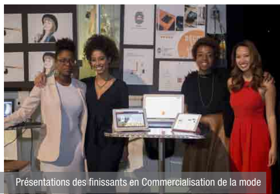
Présentations des finissants en Commercialisation de la mode